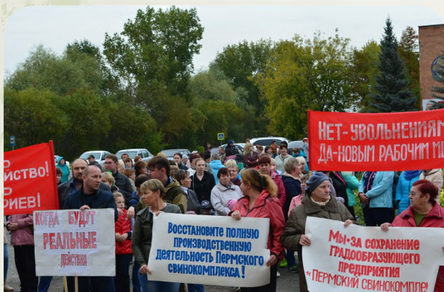
Митинг на Пермском свинокомплексе, 2017 г.