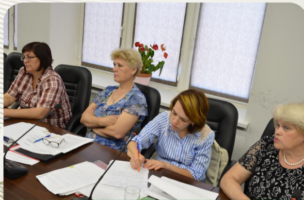
Семинар профсоюзного актива в г. Чайковский, 2018 г.