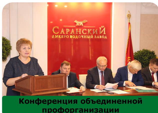
Конференция объединенной профорганизации

Также коллективным договором предусмотрен объемный социальный пакет. В частности, каждый работник получает два оклада в год к профессиональному празднику и материальную помощь в связи с уходом в очередной отпуск. Материальная помощь в размере оклада выплачивается в связи с различными жизненными ситуациями. В некоторых случаях предоставляется дополнительный оплачиваемый отпуск в количестве 5 дней. В связи с выходом на пенсию или при увольнении тем, кто отработал не менее